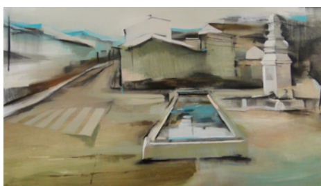
Segundo premio: El Caño , de Pepe Bonaño (Valverde del Camino)