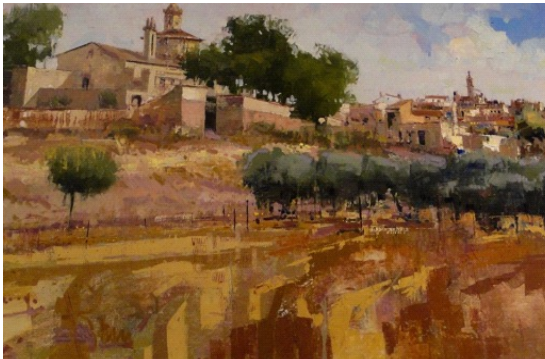
Antonio Cantero Tapia (Málaga), 2013 Antiguo convento de San Diego