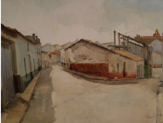
Fco. Abel Vellarino Díaz (Oliva de la Frontera), 2015 Esquina calle San Juan/calle Sagasta