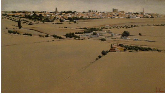
Lola Romero Martín (Aracena, Huelva), 2015 Vista de Fuente de Cantos desde el Oeste