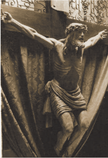
Fig. 1: Cristo Crucificado, 1961. Fuente de Cantos