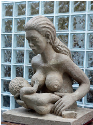
Fig. 6: Madre amamantando, 2010