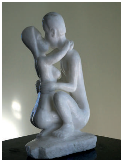
Fig. 7: Pasión, 2012