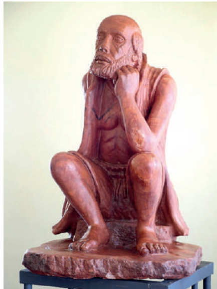
Fig. 4: Reflexión, 2007