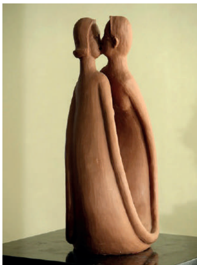
Fig. 8: Amor, 2016