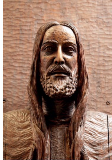
Fig. 2: Cristo glorificado, 1972 Parroquia de la Aparecida de Sao Bernardo do Campo, Brasil