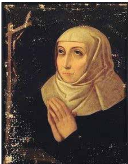
Fig. 7: Retrato de Luisa de Carvajal y Mendoza