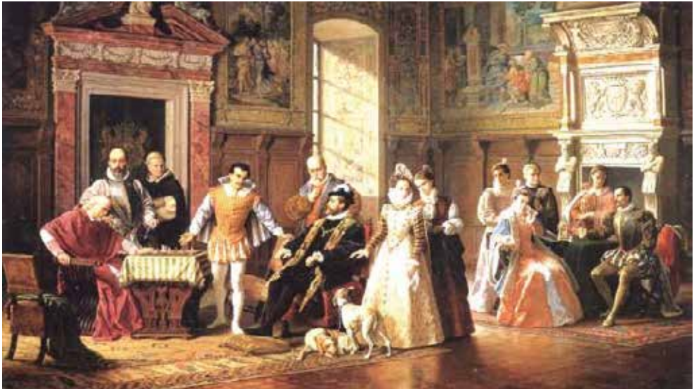
Fig. 5: Partida de ajedrez entre Ruy López de Segura y Da Cutri, 1886, Mussini