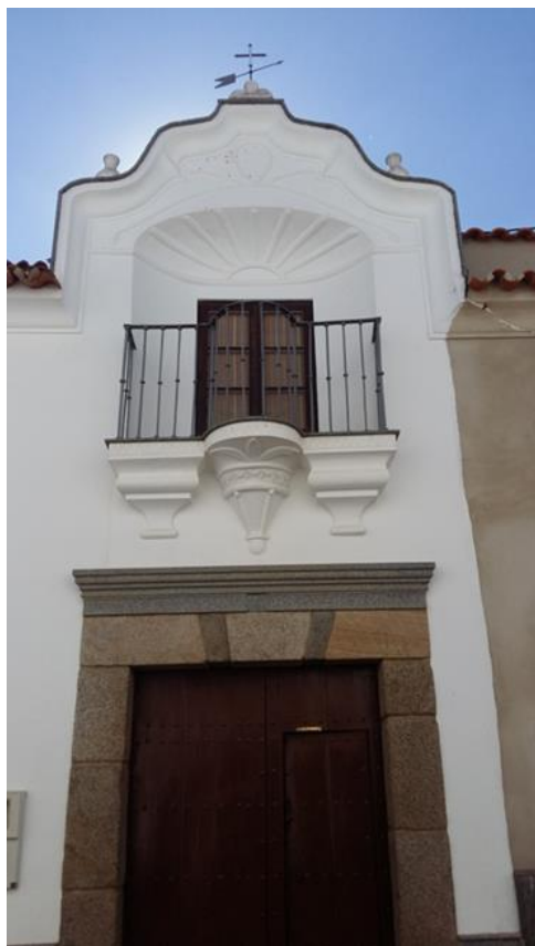
Fig. 2: Detalle de una fachada de la calle Santa Ana (s. XVI-XVII) con dintel y jambas de granito y decoración a base de molduras barrocas.

Al igual que en los edificios religiosos (Iglesia de Ntra Sra. de los Ángeles) existen materiales constructivos de acarreo, de naturaleza arqueológica, reutilizados en construcciones civiles. Es el caso de la casa solariega de la familia Gordón de Valencia en la calle Pintada, donde tras el encalado de las esquinas se puede vislumbrar la existencia de sillares de granito típicamente romanos, probablemente traídos de alguna de las villas romanas documentadas en el término municipal; o el umbral del patio de una casa en la calle Altozano, que es parte de un cimacio visigodo de mármol, decorado con motivos florales, los mismos que presenta un pollete situado en el patio de una casa de la calle Plaza.