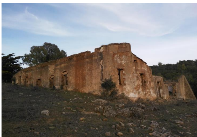
Fig. 7: Cortijo de El Candil, en la solana de la Sierra de Bienvenida, corresponde a la tipología de estancias distribuidas en torno a un patio central con un solo portón de acceso, que en este caso está decorado con molduras neoclásicas.

En cuanto al cortijo como casa de campo, podríamos establecer básicamente tres tipologías, los que presentan la misma distribución que las denominadas casas enteras dentro del casco urbano, con pasillo central y corral (cortijo de Mondragón o el de María Joaquina por ejemplo) cerrado, con acceso solamente desde la casa; otro tipo que se diferencia por tener un patio central (Fig. 7) con un solo acceso a través de un gran portón (La Fortuna, El Pizarral de la Dueña, El Candil,...), con las estancias de trabajo y habitación abiertas al interior del patio; y un tipo mixto que cuenta con características de las dos variedades anteriores (El Canchal, Maibrí,...).