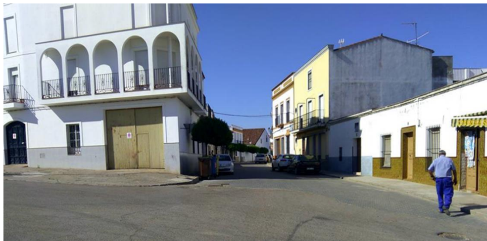
Fig. 11: Ruptura con la tipología de casa tradicional en cuanto a diseños y materiales en la calle Manuel Mejías.

Este proceso destructivo, iniciado en Extremadura a principios de la década de 1970, muy relacionado también con los entramados psicológicos derivados del fenómeno del retorno de la emigración y con cierto desarrollismo que trajo aparejado y que cundió en el resto de la sociedad rural, tiene su continuidad en la actualidad. Por consiguiente, todos los edificios que no tengan una tutela patrimonial desde la administración municipal son susceptibles de desaparecer para siempre de la noche a la mañana (Fig. 11).