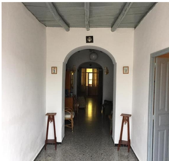
Fig. 3: Pasillo o “paso” de una “media casa” de la calle Carretera de la Estación. Puede observarse el acceso a las estancias desde el pasillo hacia la derecha.

La vivienda tradicional en esta zona de Extremadura posee características constructivas (muros de adobe o tapial de entre 60cm y 1m de grosor, dormitorios sombríos en la segunda crujía, etc...) a priori más idóneas para soportar los meses con temperaturas más altas, pero el propio aislamiento de los materiales constructivos y la presencia de una chimenea con unas medidas y una situación muy concretas, hacía posible el aporte de calor al interior de estas edificaciones. Estas chimeneas monumentales solían tener sección trapezoidal, un gran cañón para la salida de humos y una cornisa corrida llamada popularmente “topetón”. Dentro de la misma se solía utilizar como pavimento una lancha de piedra o piedras de molino (muelas) gastadas o rotas, reutilizadas (es el caso de la que se conserva en Centro Dinastía Bienvenida). La función de esta diferenciación de pavimento en la chimenea era impedir la rotura de cualquier otro tipo de solería una vez sometida al estrés térmico del fuego. La situación de la chimenea en la segunda crujía permitía la circulación del calor hacia todas las estancias de la casa, a través del pasillo central, pues se generaba una corriente debido a la situación de los vanos principales, en los extremos del mismo. La estancia donde se encuentra el fuego es el corazón de la casa, tenía reservada las funciones de cocina y sala de estar. Poseía además uno o varios huecos abiertos en la pared llamados alacenas o “chineros” (por-