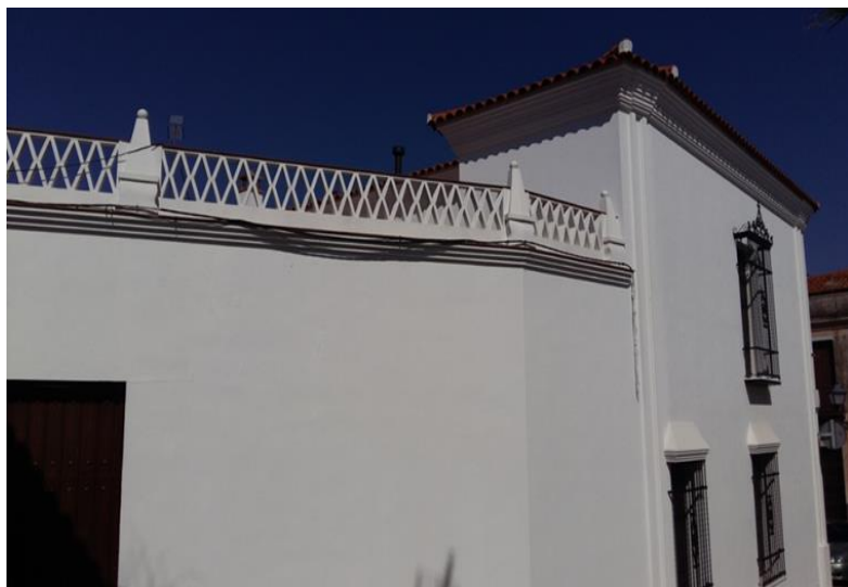
Figura 6: Pináculos barrocos en una casa de nueva planta construida a principios del siglo XXI.

En cuanto al cortijo como casa de campo, podríamos establecer básicamente tres tipologías, los que presentan la misma distribución que las denominadas casas enteras dentro del casco urbano, con pasillo central y corral (cortijo de Mondragón o el de María Joaquina por ejemplo) cerrado, con acceso solamente desde la casa; otro tipo que se diferencia por tener un patio central (Fig. 7) con un solo acceso a través de un gran portón (La Fortuna, El Pizarral de la Dueña, El Candil,...), con las estancias de trabajo y habitación abiertas al interior del patio; y un tipo mixto que cuenta con características de las dos variedades anteriores (El Canchal, Maibrí,...).