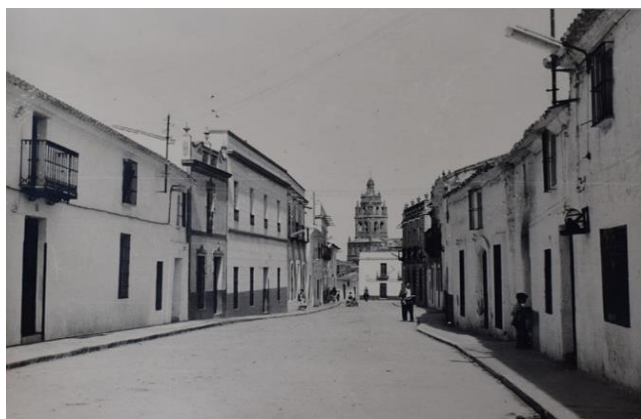
Fig. 10: Cambios experimentados entre la década de 1950 y 2010 en la conexión de la calle Llerena con la calle Cantón.

La ausencia de protección legal, unida a la falta de sensibilidad social ante un patrimonio tan frágil, pero tan importante, además de otras circunstancias, han provocado la desaparición en los últimos 25 años de bastantes edificios que podríamos clasificar como pertenecientes a la arquitectura tradicional, en favor de diseños arquitectónicos estandarizados, materiales que causan estridencia en el paisaje urbano y la ruptura con una homogeneidad constructiva que ha caracterizado a nuestros municipios a lo largo de los siglos (Fig. 10).