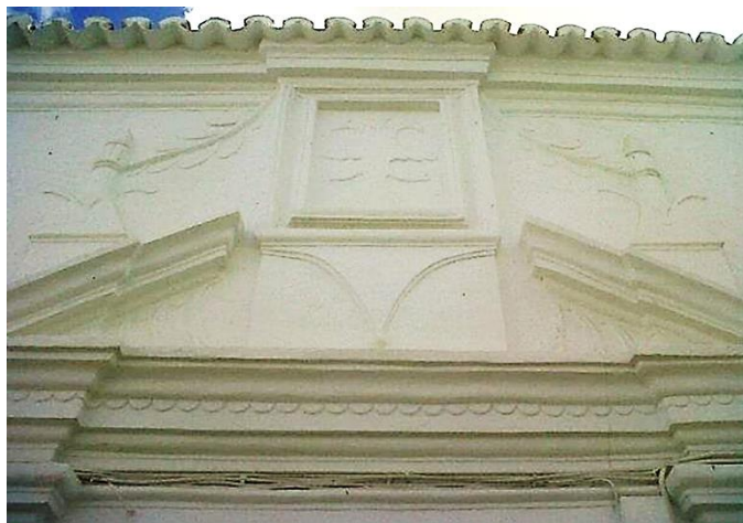
Fig. 4: Molduras decorativas con motivos heráldicos, casa de la familia Gordón de Valencia en la calle Vicario Juan Riero.

Hemos documentado varias molduras zoomorfas, dos de ellas con significado heráldico, una consiste en un león coronado, rampante hacia la derecha, rodeado de una orla de motivos vegetales, junto al blasón de la casa de la familia Gutiérrez de la Barreda, caballeros de Santiago, en la calle Santa Ana. Un águila bicéfala (cuyas cabezas tienen aspecto de pavones), dentro de una hornacina sobre la puerta principal, en la fachada de la casa de la familia Gordón de Valencia (el águila bicéfala está entre sus armas de blasón) en la calle Vicario Juan Riero (Fig. 4). Por último, un gran dragón serpentiforme alado, en el lateral del remate superior de la fachada de los condes de Casa-Henestrosa.