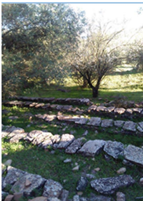
Figura 9: Interior aterrizado del cortín o cortino colmenero de la Sierra de Bienvenida. Rodeado por un alto muro circular, hoy bastante deteriorado en algunos puntos, tuvo como cometido preservar las colmenas de la acción de los osos, que se veían atraídos por la miel.

Dentro de las construcciones auxiliares tradicionales en las explotaciones agropecuarias señalamos por su rareza un cortín o cortino colmenero fortificado, situado en la ladera de la solana de la Sierra de Bienvenida. Se trata de una estructura circular cercada por una gruesa pared de mampostería con mechinales y un solo acceso a través de un pequeño vano, cuyo interior se encuentra aterrizado para albergar las colmenas de corcho (Fig. 9). La alta y recia cerca de piedra impedía el ataque de los osos que acudían atraídos por la miel. Se conocen pocos en Extremadura, la mayoría en la provincia de Cáceres. Un gran acebuche que ha crecido en su interior puede ser la evidencia palpable de que la pérdida de su uso original contra los osos pudo ocurrir aproximadamente hace unos 300 años.