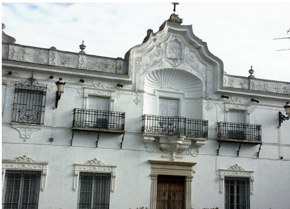
Fig. 5: Casa solariega de la familia Jaraquemada, con una gran variedad de molduras decorativas de temática heráldica, mitológica, etc.

Los blasones de mármol y los motivos heráldicos en pintura mural son también variados, pues documentamos la presencia de las armas de los condes de Villa Santa Ana, Chaves-Porras, Carrascal, Cabeza de Vaca, Gordón de Valencia, Vázquez de Mondragón, Carvajal, etc.